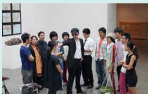
「Reversible Collection」2009 水戸芸術館現代美術ギャラリー