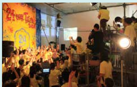
「24 OUR TELEVISION」2010 青森公立大学 国際芸術センター青森 (ACAC)