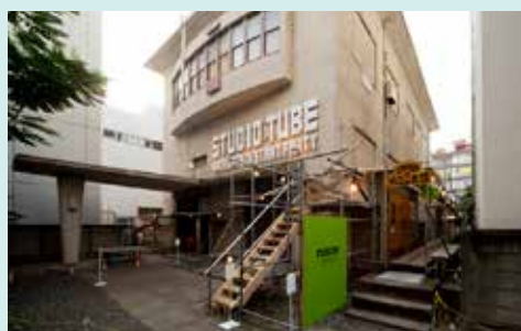
「STUDIO TUBE」2013 あいちトリエンナーレ2013