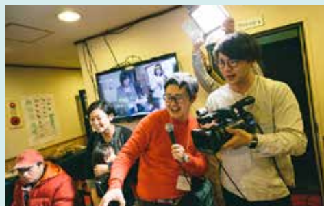
Nadegata Instant Party

創造都市札幌の芸術・文化の未来を拓こうと、2007年春に市民有志が立ち上げた団体。市民と芸術家そして行政、企業を結ぶネットワークを形成し、さまざまなイベントを実施し、情報を発信している。市民らの協働による芸術・文化の溢れるまち作りを目標としている。代表は上田文雄(前札幌市長)