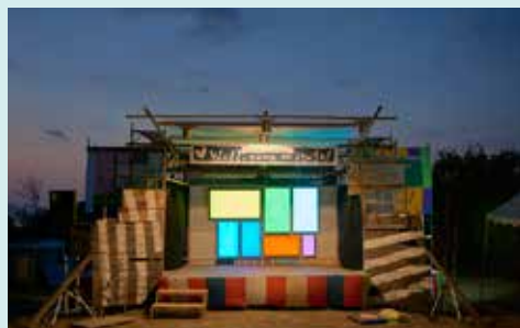
「Well, come on stage.」2016 瀬戸内国際芸術祭2016