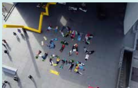
「HOME STAY HOME」2021 丸亀市猪熊弦一郎現代美術館